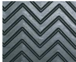
特許取得のシェvronベルトパターン