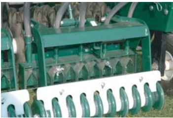
特許種分配ボックス

特許波型ブレードの断続的な回転により、サッチ等を掻き上げずに、スクエア型の溝を掘削