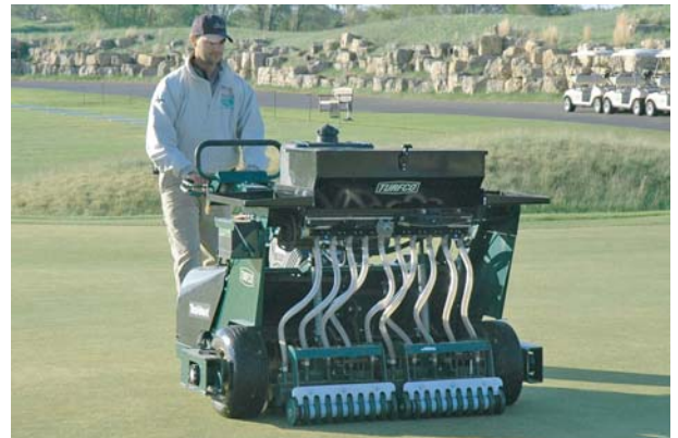
歩行タイプ 作業しながらの旋回も可能！