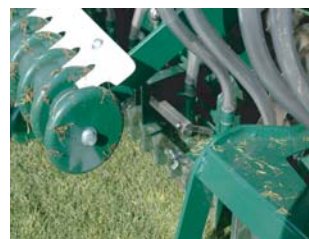
深度調整は工具無しの簡単操作で作業時のコンディションに合わせて素早く調整が可能です。