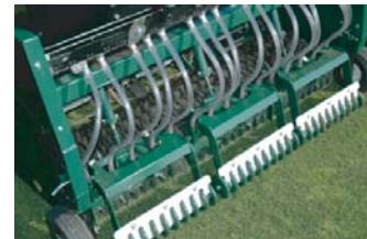
フローティングヘッドは土と種子の接触率が高く、播種の深度を深い位置で維持します。