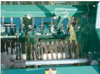
特許波型ブレード

独自の播種機構により同機種比No. 1の発芽率を実現!! 表層を乱すことなく、多様な作業要求にお応えします。