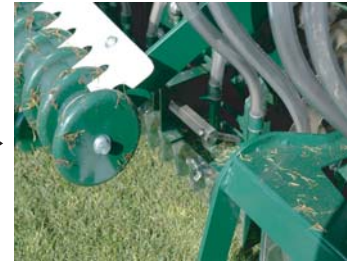
種と土とのコンタクトを確かにする リアローラー装備