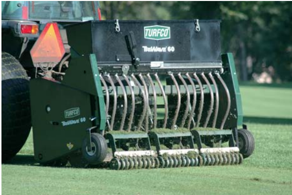
PTOタイプ 推奨トラクター馬力は50HP以上