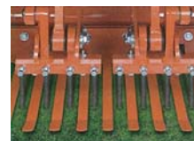
ターフリテイナー