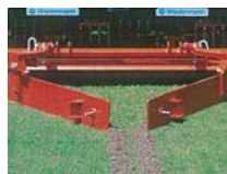
スワッシュボード