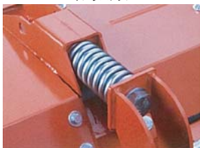
バイブラストップ