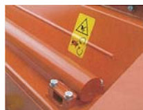
ヘビーデューティーウエイト